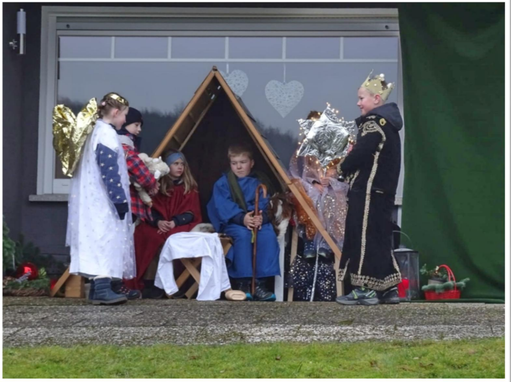
Krippenspiel in Volkholz