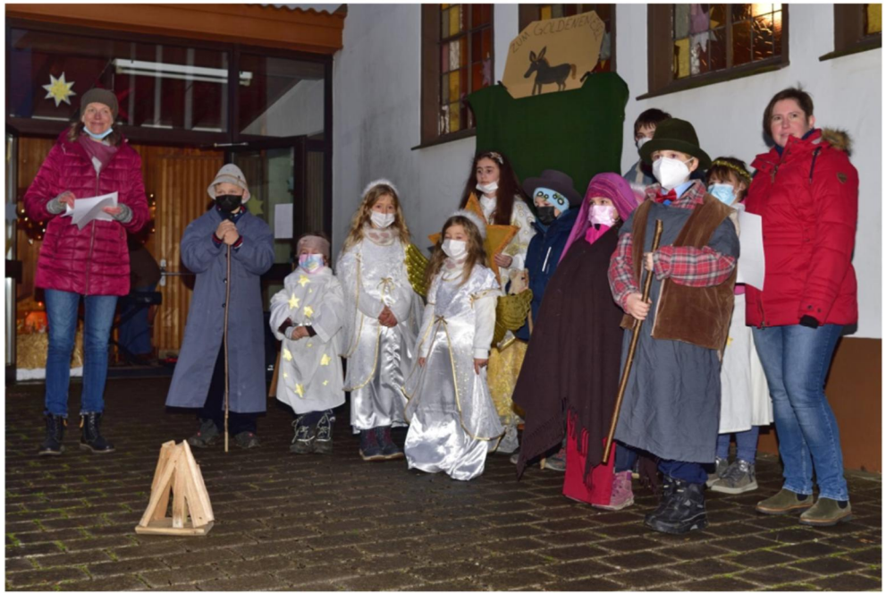
Alle Oberndorfer Darsteller in einem Bild