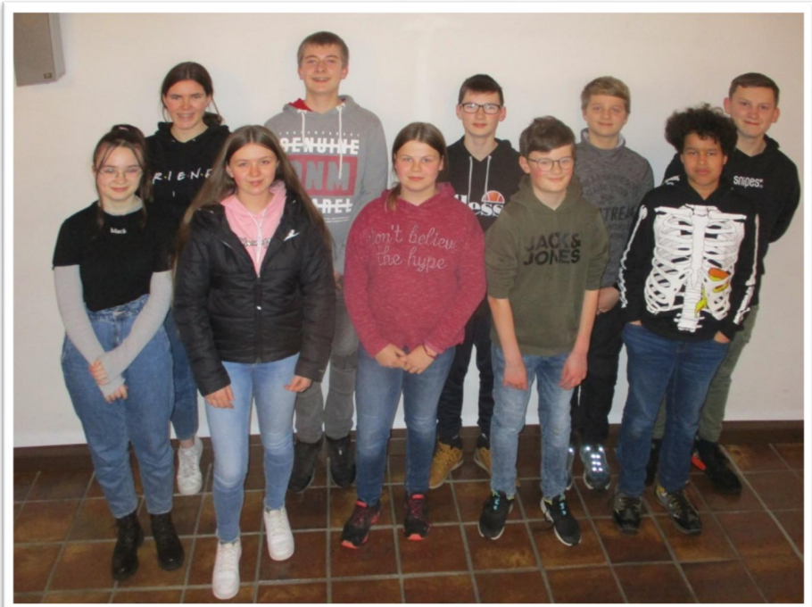
Die Oberndorfer Gruppe der Konfirmanden