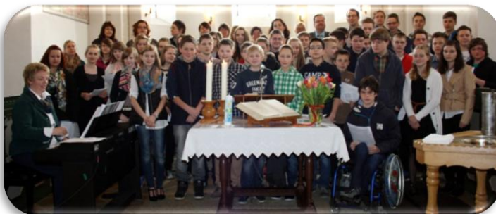
Konfirmanden und TonSpuren.