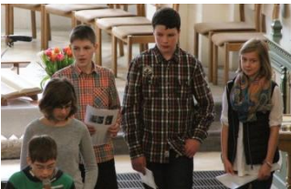
Vorbereitete Gebete wurden vorgetragen.

Am 6. April stellten sich die Konfirmanden des gesamten Kirchspiels der Gemeinde vor.